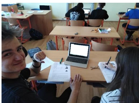
Práce na mini notebookech

Dne 16. 4. od 14.00 do 15:30 se uskutečnil den otevřených dveří. Nejprve jsme zavítali do pátých ročníků, kde v jedné třídě zkoumali vodu. A ve druhé vytvářeli obrázky metodou enkaustiky. Dále jsme postupovali do pavilonu 1. stupně, konkrétně do 1. patra. Zde někteří žáci hráli na flétnu a evidentně po našem odchodu se také uskutečnilo nějaké divadelní představení, neboť „nehráči“ byli oblečeni do kostýmů. Ve 4.