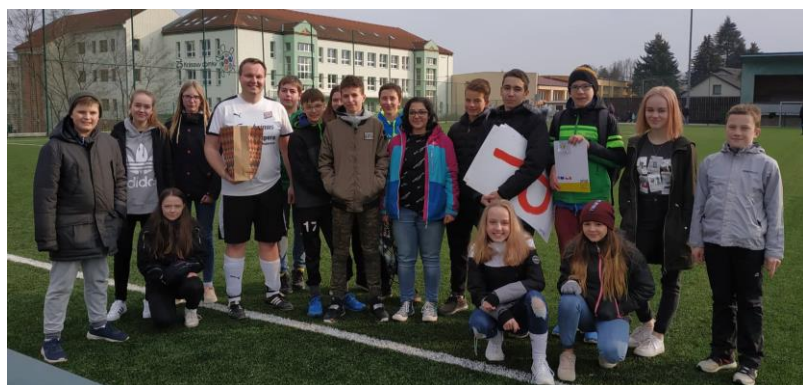
Společné foto pana učitele s třídami

Výsledek je špatnej, minulej zápas jsme prohráli, taky vysoko - 5 : 3 a tak jsme teď chtěli uhrát nějaký body a musíme počkat zase do příštího zápasu.