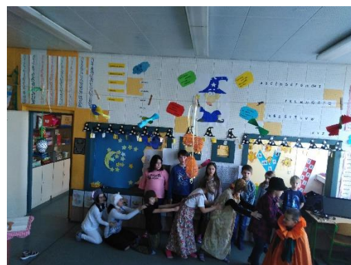
Pohádka O veliké řepě

Dne 16. 4. od 14.00 do 15:30 se uskutečnil den otevřených dveří. Nejprve jsme zavítali do pátých ročníků, kde v jedné třídě zkoumali vodu. A ve druhé vytvářeli obrázky metodou enkaustiky. Dále jsme postupovali do pavilonu 1. stupně, konkrétně do 1. patra. Zde někteří žáci hráli na flétnu a evidentně po našem odchodu se také uskutečnilo nějaké divadelní představení, neboť „nehráči“ byli oblečeni do kostýmů. Ve 4.