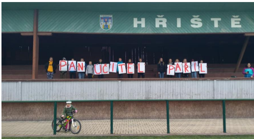
Fanoušci s transparentem

Maraton od začátku vedl, ovšem chvíli před koncem byl rozdíl pouze jednoho gólu. Zápas skončil 7: 4, jelikož Maraton dal v posledních minutách zápasu další dva góly.