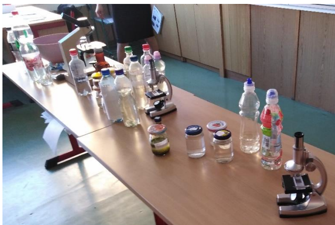
Zkoumání vody v 5. A