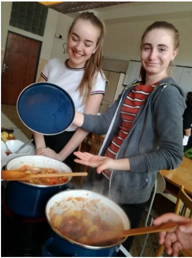
Eintopf je již hotový

Víte co je to Eintopf? Podle dětí z učebnice němčiny rozhodně nic dobrého. Rozhodli jsme se to ověřit. Ve středu 27. 3. jsme si uvařili svůj vlastní Eintopf. Dostali jsme za úkol najít si každý svůj recept na internetu, ale měl být německy a překládat se měl až na místě pomocí slovníků. Utvořili jsme skupiny po pěti. Každá z nich měla jiný recept. Suroviny, které recept vyžadoval, jsme si předem přinesli z domova, nebo nakoupili. Pro všechny to bylo zábavné a naučili jsme se i nová slovíčka. Někomu výsledek chutnal, někomu ne. Většina skupin měla Eintopf moc hustý, ale nikomu to nevadilo. Podle nás je tedy názor německých dětí na Eintopf trochu nespravedlivý.