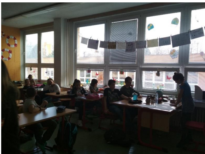
Paní učitelka kontroluje testy