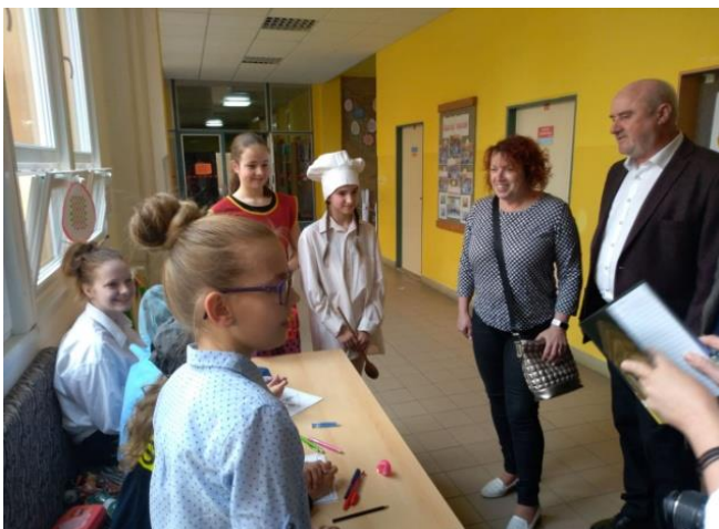
Zastupitelé města u prvního stanoviště

Celkem bylo přijato 39 žáků, plus dalších 6 jich dostalo odklad.