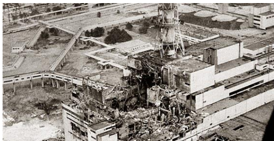
Pohled na Jadernou elektrárnu z vrtulníku

Černobyl je město na Ukrajině. Nejznámější je kvůli havárii zdejší jaderné elektrárny 26. dubna 1986.